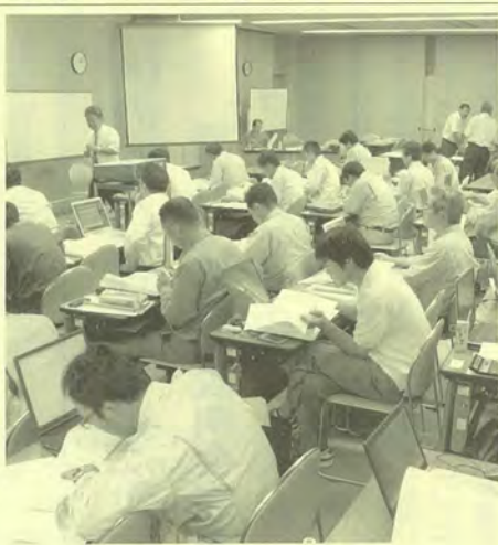
積算の実務を行う参加者