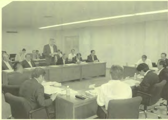
県議会自民党に対する要望説明

(社)県建設産業団体連合 二十一年度予算編成に向け、九月十八日に平成 けた県議会自民党、公明