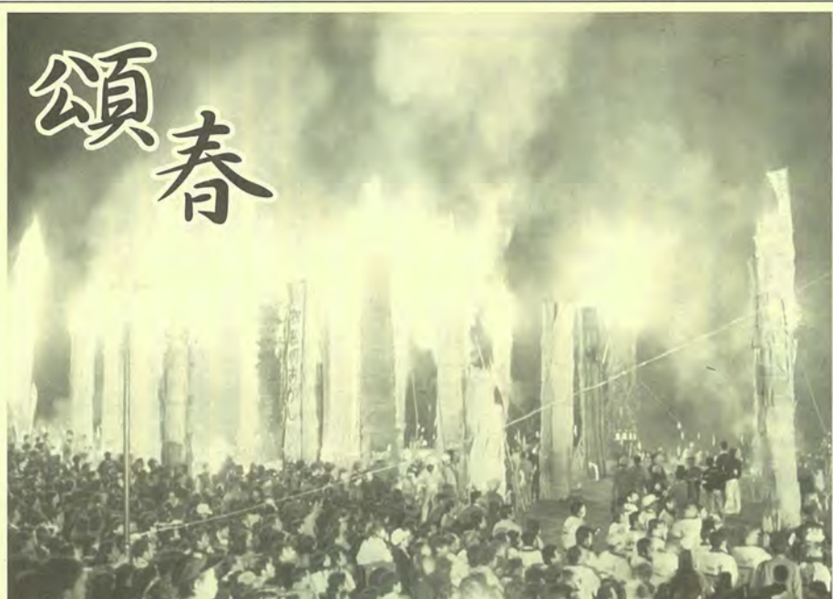
日本三大火まつり 須賀川の松明あかし

平成二十二年の新春を 迎えるにあたり、謹んで へと政治の物差しが変わ 年頭のあいさつを申しあ げます。 昨年八月の総選挙では 政権交代を訴えた民主党 が圧勝し、「作る側の論 理」から「消費者の目線」 へと政治の物差しが変わ るもようです。新政権に よる予算の見直しが行わ れ、民主党のマニフェス ト実現に向けた動きが活 化(建設産業はオールド ン・エコノミーとして縮小) 等々の方向が示されまし た。