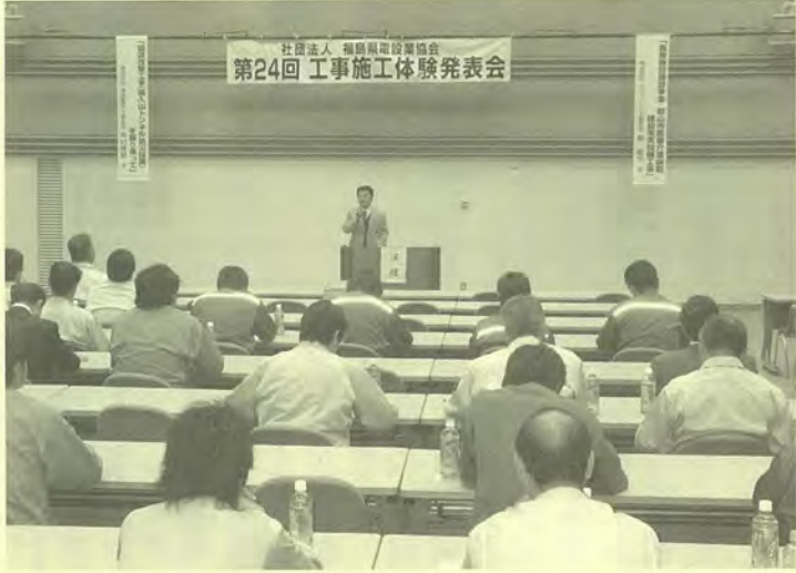
社団法人 福島県電設協会 第24回 工事施工体験発表会

国道四〇〇号田島バイパスは、県南会津建設事務所管内で平成五年度に第一工区に着手、九年度に第二工区に着手し、今年度から第三工区に着手し、延び続け第二工区に着手され現在に至ります。第一一五七九が、幅員六