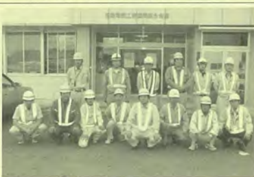
奉仕作業を行った会員ら