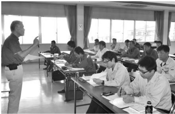
合格目指して真剣に講義に臨む受講者