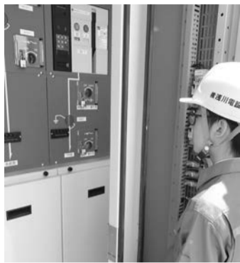
白河支部は6月12日から16日まで、県立白河実業高校のインターンシップを受け入れた。写真：通して、健全な職業観、勤労観を育成することなど。田電気工業、浅川電設、東陽電気工業で電気設備工事の業務を体験し、進歩した。