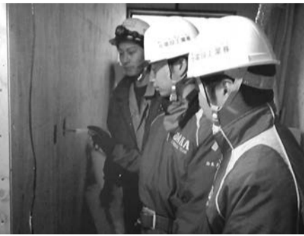
現場実習する生徒

相双支部は1月24日から27日にかけて、県立小高工業高校電気科のインターンシップに協力した。旭電設工業、旭電気工事、青田電気商会、早川電気工業、高木電気商会の5社が生徒を受け入れ、電気設備工事の魅力