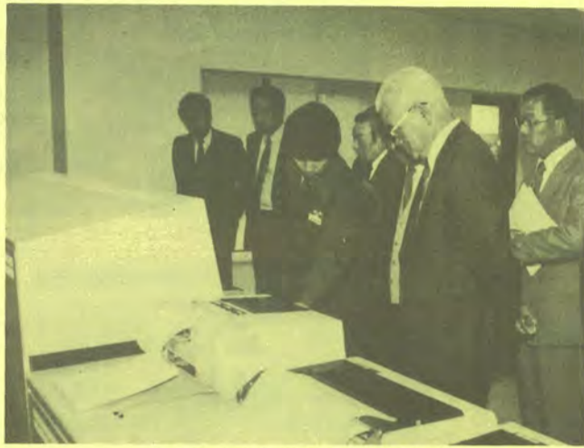
中央監視室を視察する技術委員