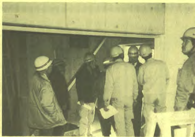
現場をパトロールする一行

26日から7会場 県共通仕様書説明会 県土木部監修による「福島県建築・設備工事共通仕様書(六十二年版)」の説明会が一月二十六日から県内七カ所で行われる。 同仕様書は、従来県独自で作成していた各工種別の仕様書や標準図が整理統合され含められたほか、これまで特記仕様書で扱われていた分についても、ある程度吸収されている。六十二年以降の発注工事について、来年四月一日から適用される。 説明会は、各会場とも午前十時から午後四時までで、午前十一時以降に、建築・電気・機械は、それぞれ分科会で説明が行われる。参加費は無料。