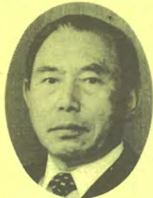
(社)福島県電設業協会

このような情勢の中で本協会といたしましては、関係諸官公庁等に受注機会の拡大、分離発注の促進方をご要望申し上げるとともに、研修、講習会の開催や工事施工体験発表会等、技術水準向上方策を積極的に取り組んでまいりました。 又機関紙を通じた確かな情報を提供するなど各般に亘る諸事業を進めてまいりました。