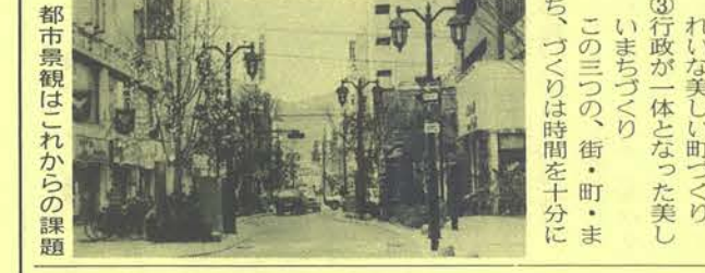
都市景観はこれからの課題