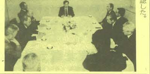
長)が陳情を行った。

般に知らせるシステムが必要になる」と述べ、幹線道路の要所に情報板を設置しそれを制御するシステムを構築する必要性を強調し、他の出席者からも同意を得た。