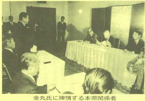
金丸氏に陳情する本県関係者