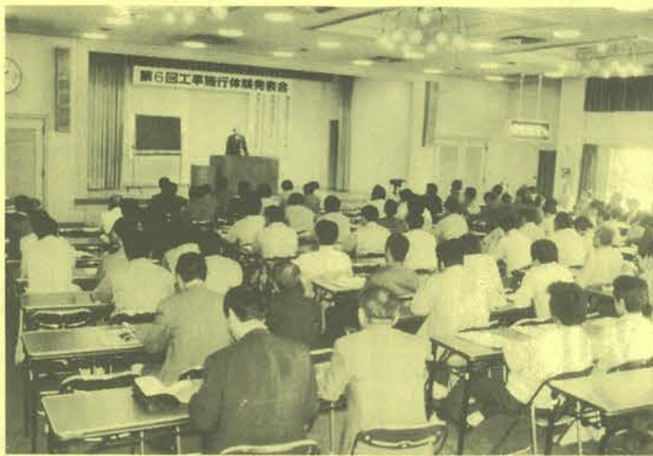
来賓も多数出席した今年の体験発表会

発表会では、はじめに大槻清会長があいさつ「この催しの我々にとって大問題であるのは施工技術向上のために万難を排して毎年行っている。人手不足を解決し、業界を発