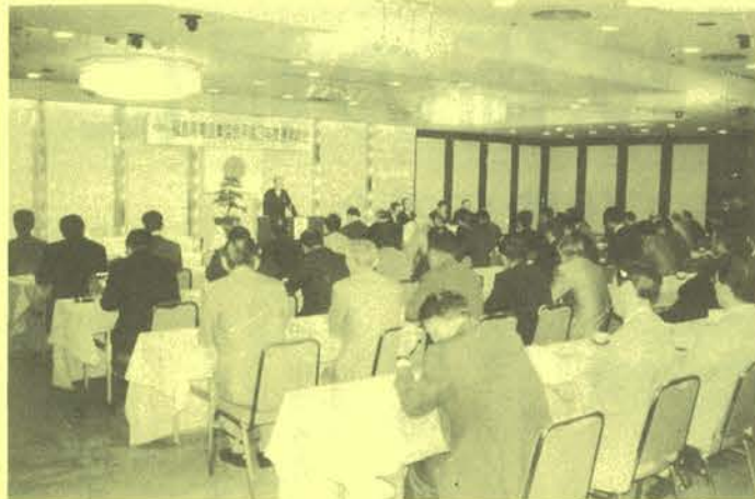
新年度事業計画を決定した総会