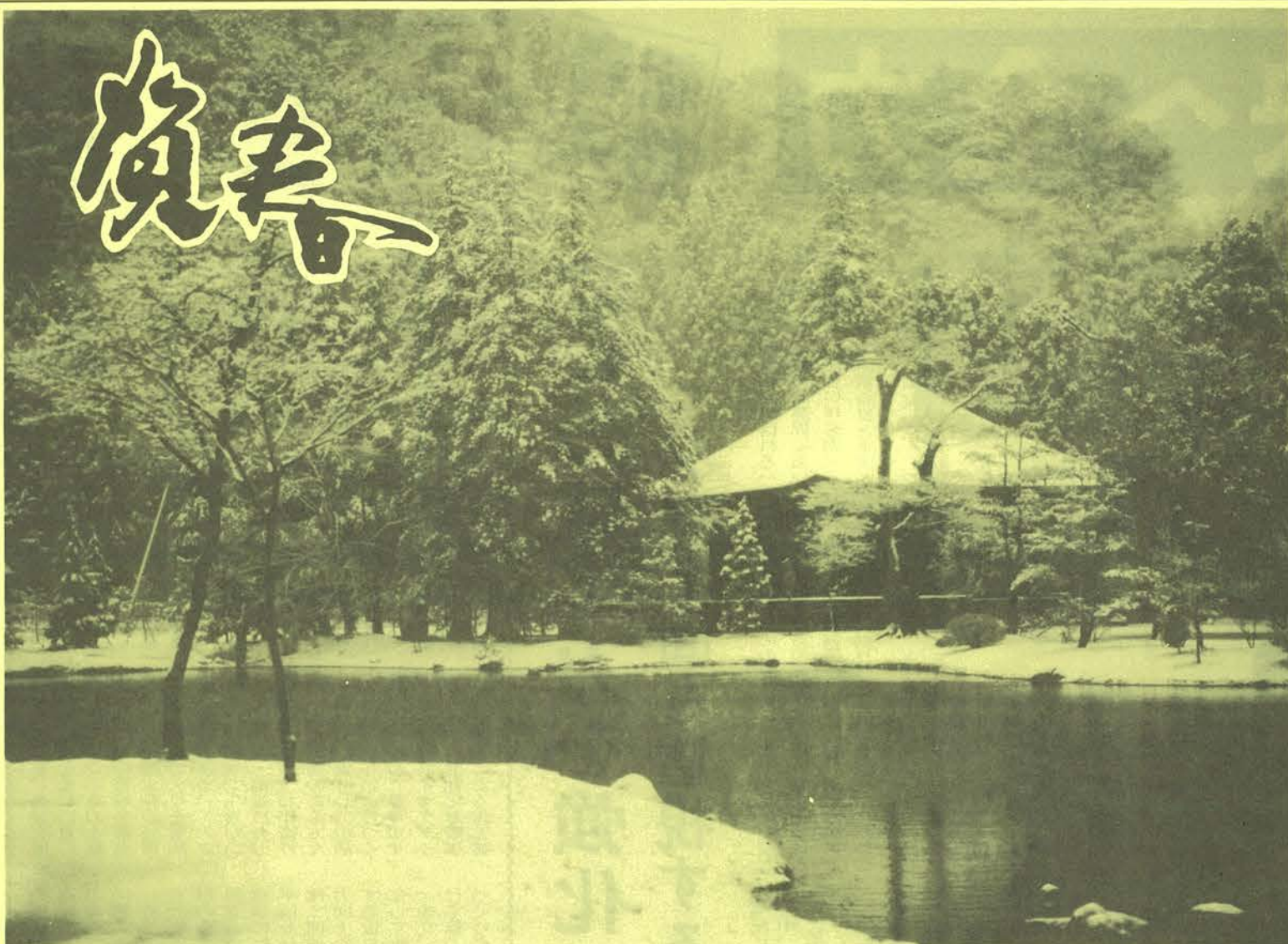
国宝白水阿弥陀堂（いわき市）