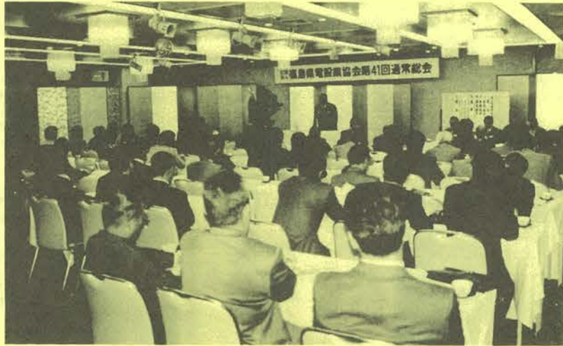
5月15日に福島市で開かれた第41回通常総会

本社 いわき市平谷川瀬字明治町二七 ☎(0246) 251-6111 営業所 白河・郡山六・郡山北・会津・原町 福島・いわき南・他 県外十一カ所