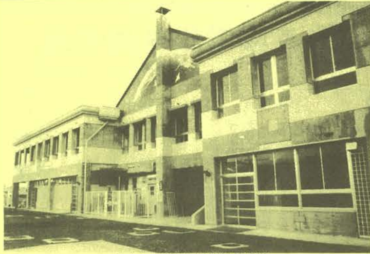
県立会津養護学校新築第3期