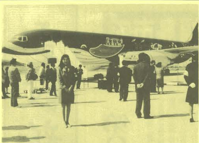
福島空港の開港一周年行事

影会のほか、機内用品即売会、旅行チラシ配布⑥就航先PRコーナー⑦管制塔見学、空港特殊車両展示⑧マリオンジャンボ体験フライト⑨さらさら同機内見学会(写真参照)。