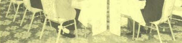
県空衛協との第2回懇談会(福島市) 新入札制度への対応を協議するとともに地元業者の役割について様々な意見が交換された

しかし、地元業者活用へのメリットについては、発注機関に理解されていない面もあることからPRが必要との認識で一致し、活動の原点に返って分離発注の実施を各発注機関に求めて行くことを決めた。さらに、新しい入札制度の中で何をアピールできるか