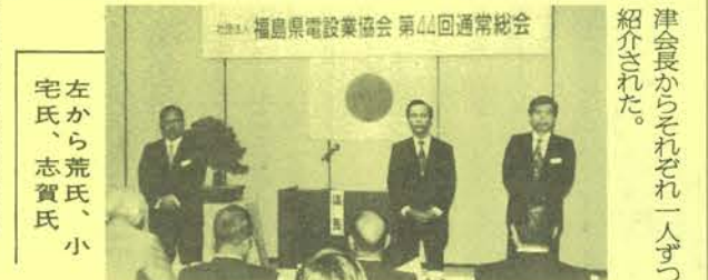
左から荒氏、小宅氏、志賀氏