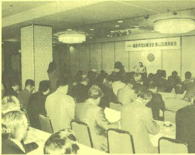
5月17日に来賓多数を招き盛大に行われた総会