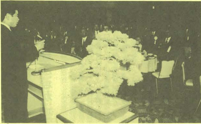
40周年を祝いさらなる発展を祈っての乾杯