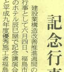
建設業構造改善推進週間の行事として六月四日、福島市のホテル辰巳屋で記念講演会と平成九年度優秀施工者福島県と（財）県建設業団体連合

引続き行われた議事では平成八年度の事業報告・決算、九年度事業計画・予算案を原案通り承認し、建設工事業の継続的確保・拡大についての陳情や要望、適正工期