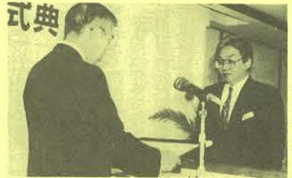
吉田氏代理(歴代会長)