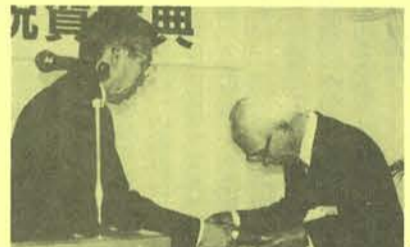
池添氏(設立時からの会員)