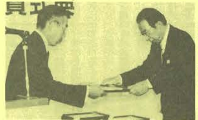
坂本氏代理(歴代会長)