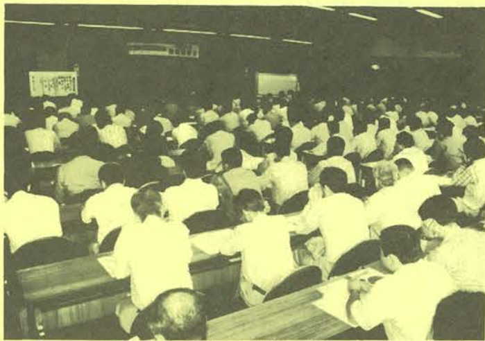
270人が出席した技術講習会