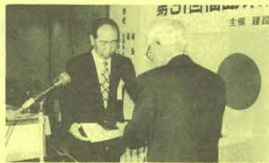
安全競争で優勝した小名浜電設

第三十一回福島県建設業労働災害防止大会が七月二十九日午後一時から郡山市のホテル辰巳屋で開かれ、本協会代表の電気工事部門では、小名浜電設が優勝、準優勝のクレハ電機(株)、第一位の角渡電業とともに表彰状を受けた。