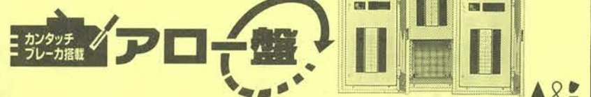
カンタッチアロー盤