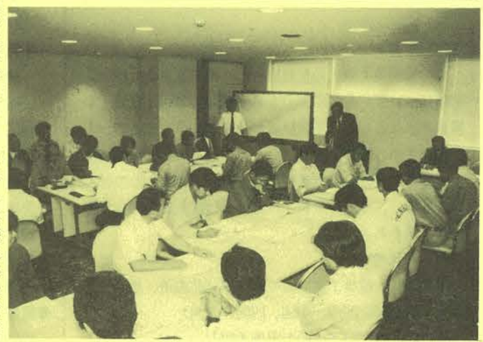
VE等をテーマとした電気関係の分科会

（県）建設業協会福島支部、本協会福島支部などの建設関係五団体の共催による建築関係団体技術研修会が七月十五日、福島市の福島テルサで開