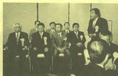
表彰を受けた退任役員