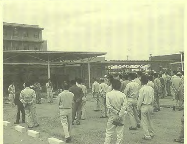
病院前で施設の説明を受ける参加者