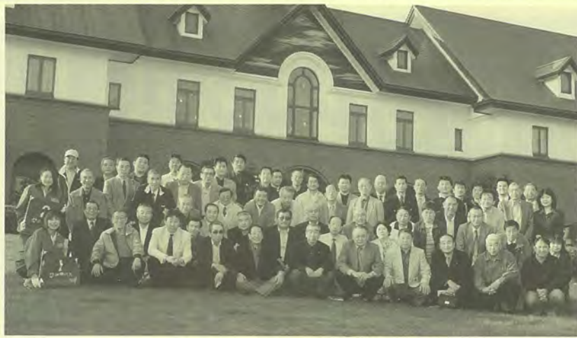
ユーカラ工芸館(旭川)を訪れた研修旅行参加者

平成十五年度の研修旅行 峡・十勝・富良野を見て歩は、五月九日から十一日まで、早春の道央巡りとして実地三日間の日程で、会