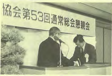
協会第53回通常総会懇親会

次に来賓祝辞が行われ、 県議会の小野民平副議長 (議長代理)が「県民生活 に密着した必要不可欠な社 会資本は、本県の発展を支 える基盤であり着実かつ効 果的に整備していく必要が ある。皆様には社会資本整 備の担い手としてだけでな