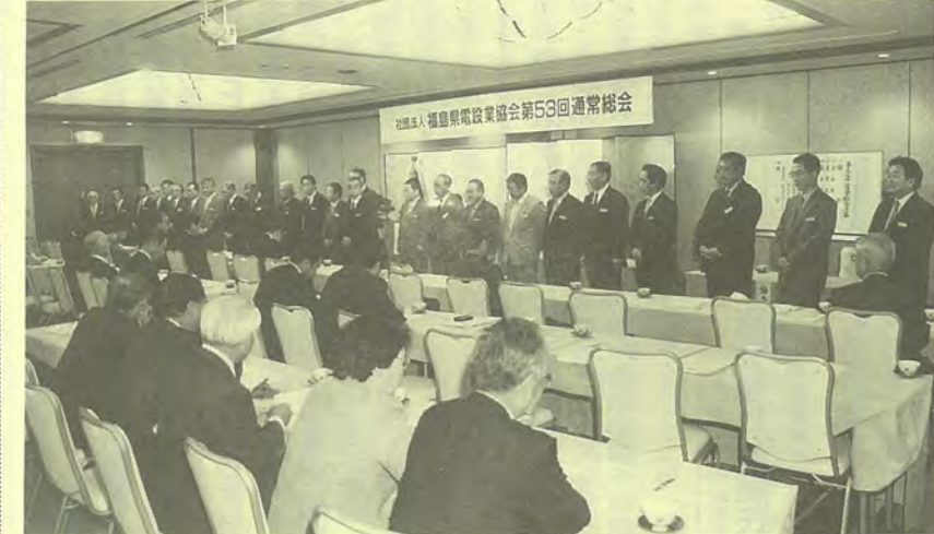
任期満了による改選で選ばれた新役員

者集団への推進④会員企業後継者の育成と社員資質の向上⑤地域社会への貢献⑥建設関係機関、友好団体との連携強化を重点目標に掲げた。実施事業としては、分離発注と地元業者活用を求める要望陳情をはじめ、技術力向上に向けた調査