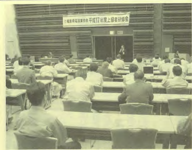
インターネットを活用した体験実習を行った研修会

当協会は地元電気設備工事業者が、こうした通信分野に乗り遅れることがないよう、今回の研修会を企画した。